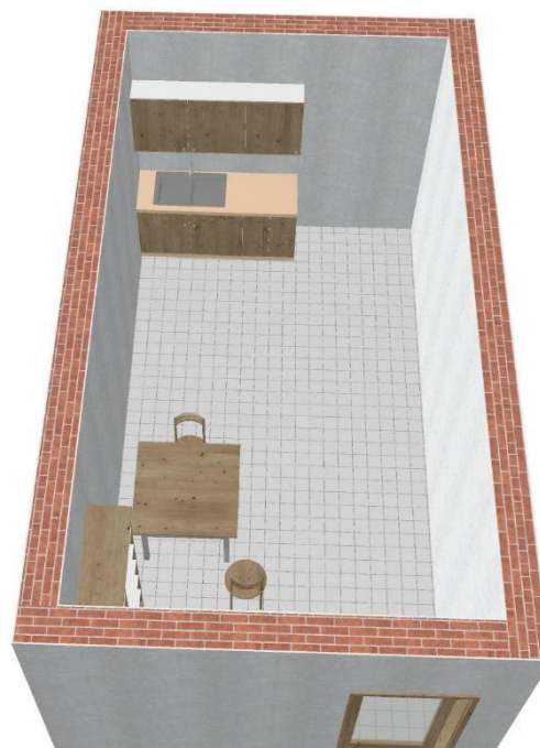
Εικόνα 1 Τρισδιάστατη άποψη του δωματίου

Το Δωμάτιο Απόδρασης μπορεί να χωριστεί σε δυο υποπεριοχές. Η μία πιο κοντά στην είσοδο είναι το καθιστικό όπου βρίσκεται ένα τραπέζι με 2 καρέκλες και μια βιβλιοθήκη όπου υπάρχουν κάποια βιβλία και ένα σεντούκι. Στη δεύτερη υποπεριοχή είναι μια κουζίνα.