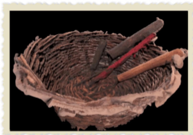
Εικόνα 5 Τιμητήρια: εργαλεία για «κέντημα»

Μέσα στον φάκελο τοποθετείται μια φωτογραφία με το τιμητήρι (εργαλείο για το κέντημα) (εικόνα 4) και ένας φάκελος με σημάνσεις στις ενδείξεις των 5,10,15 and 20mm (figure 5). Τοποθετείται επίσης, μια εικόνα μαστιχόδεντρου το οποίο έχει υποστεί κέντημα όπου κάποιες χαραξίες επισημαίνονται με νούμερα.