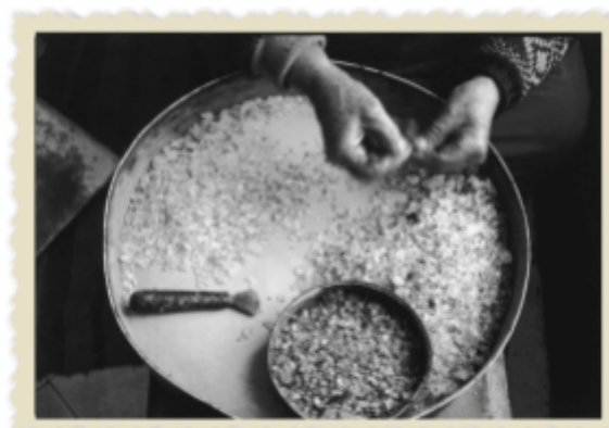
Εικόνα 3 Κοσκίνισμα συλλεγμένης μαστίχας

Τοποθετούμε το ημερολόγιο, το σημείωμα και το άλμπουμ στο τραπέζι σε τυχαία θέση. Δίπλα στο τραπέζι τοποθετούμε την καρέκλα(ες).