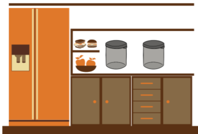
Εικόνα 10 Ντουλάπι κουζίνας με δύο βάζα με σύγχρονα προϊόντα μαστίχας

Μέσα στο ράφι της κουζίνας που χωράει 2 βάζα, οι παικτ(ρι)ες θα βρουν μόνο ένα βάζο μαστίχας. Στο καπάκι του πρώτου βάζου γράφει «δώρο για τον παραγωγό που μας στηρίζει τόσα χρόνια». Δίπλα στο βάζο, οι παίκτες θα βρουν επίσης ένα σημείωμα και αφού το διαβάσουν θα καταλάβουν ότι η γιαγιά έχει πάρει το βάζο από τη θέση που λείπει για να το κάνει δώρο σε αυτόν τον παραγωγό. Στο σημείο που λείπει το άλλο βάζο υπάρχει ένας κατάλογος και πάνω του ένα μικρό κουτί με λουκέτο. Ο κατάλογος περιλαμβάνει προϊόντα και από τους δύο παραγωγούς. Οι παικτ(ρι)ες πρέπει να αναγνωρίσουν τα προϊόντα του δεύτερου παραγωγού και να αθροίσουν την τιμή των