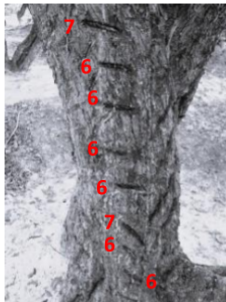
Εικόνα 6 Κεντημένος κορμός μαστιχόδεντρου