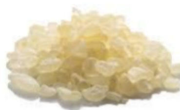
Εικόνα 8 Ρητίνη μαστίχας