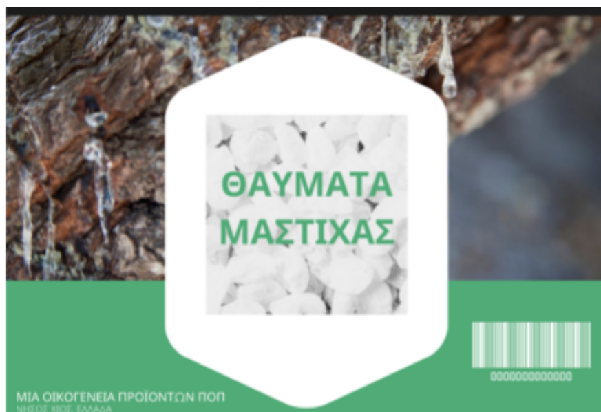
Εικόνα 11, κατάλογος προϊόντων