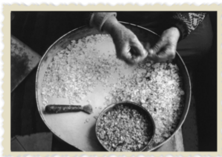
Εικόνα 7 Κοσκίνισμα μαστίχας

Στον φάκελο αυτό εσωκλείεται μια φωτογραφία με ένα κόσκινο (εικόνα 7). Επιπλέον, υπάρχουν 5 μικρότερες φωτογραφίες, δύο από τις οποίες απεικονίζουν σκουπίδια (εικόνα 9) και σημειώνονται με τον αριθμό 5 στην πίσω πλευρά και οι υπόλοιπες τρεις απεικονίζουν ρητίνη μαστίχας (εικόνα 8) και σημειώνονται με τον αριθμό 8 στην πίσω τους πλευρά.