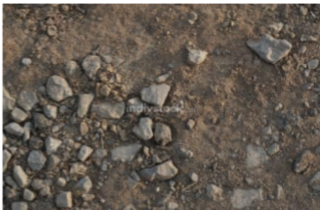
Εικόνα 9 σκουπίδια που απομακρύνονται από τη ρητίνη μαστίχας

Αφού κλείσουν και οι δύο φάκελοι, τους τοποθετούμε στο μπαούλο. Έπειτα, ο/η συντονιστής/συντονίστρια παιχνιδιού κλειδώνει το σεντούκι με 3ψήφιο λουκέτο (PIN 682) και το τοποθετεί στο ράφι.